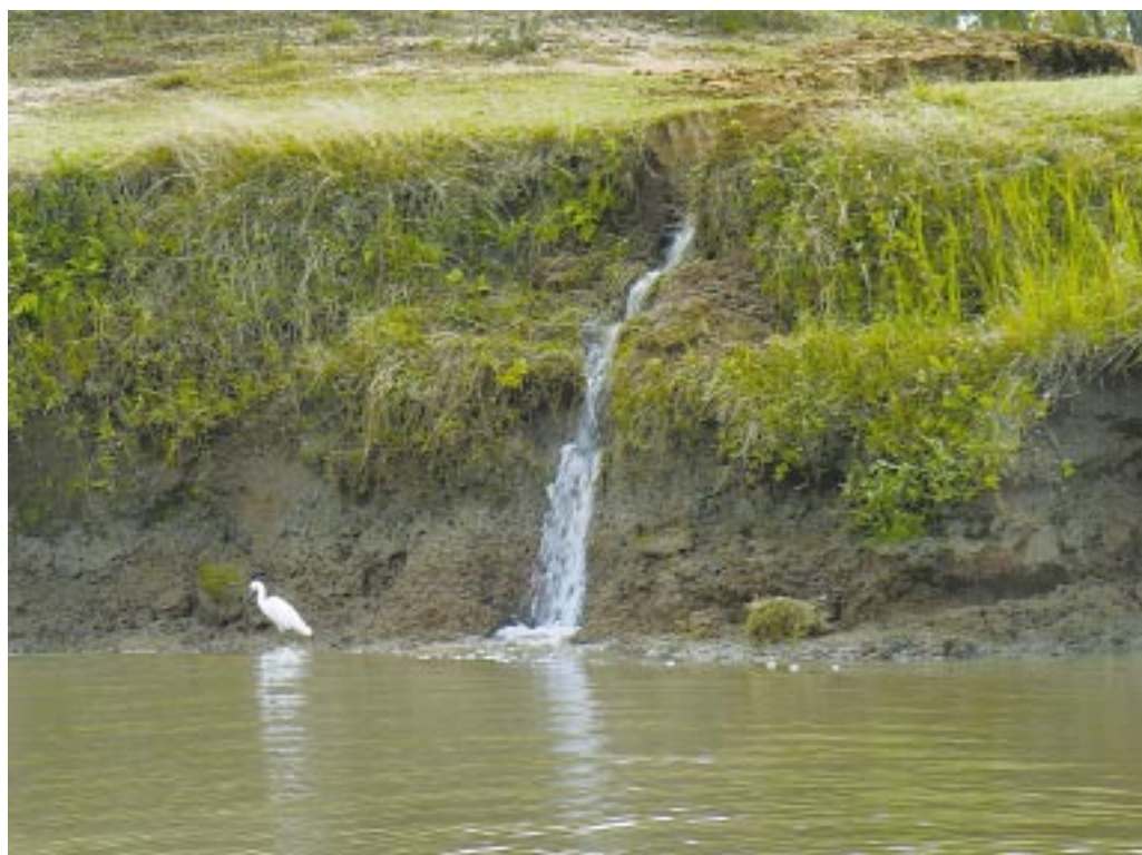
Afluente e majestade: o Jacuí é um dos rios mais importantes do Rio Grande do Sul e hidrovía-corredor do Mercosul

Os passeios pelo Rio Jacuí poderiam ser feitos até Rio Pardo ou de volta a Cachoeira. A outra metade da viagem incluiria a utilização do Trem dos Pampas, projeto que está sendo tocado