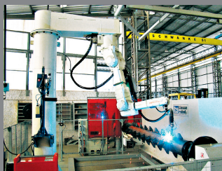
Robô de solda