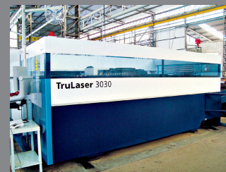
Máquina de corte