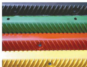
Barras de cilindro