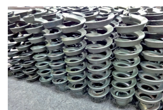
Peças para plantadeiras