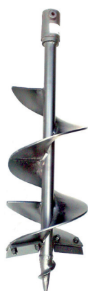
Perfurador de solo

Fundada em 1995, a SCREW INDÚSTRIA METALMECÂNICA S/A é uma empresa do Grupo Agropertences S/A, de Cachoeira do Sul (RS). Ela é especializada na produção de diversos tipos de transportadoras helicoidais em inúmeras configurações, além de vários tipos de peças para máquinas e equipamentos agrícolas e industriais.